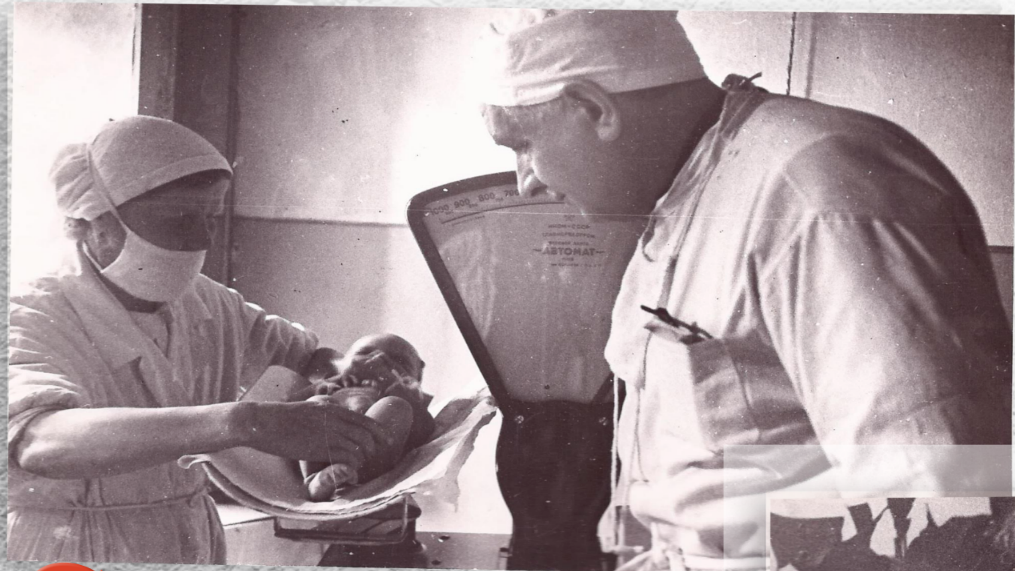
Взвешивание новорожденного в родильном доме им. Снегирева (июль 1942 г.)