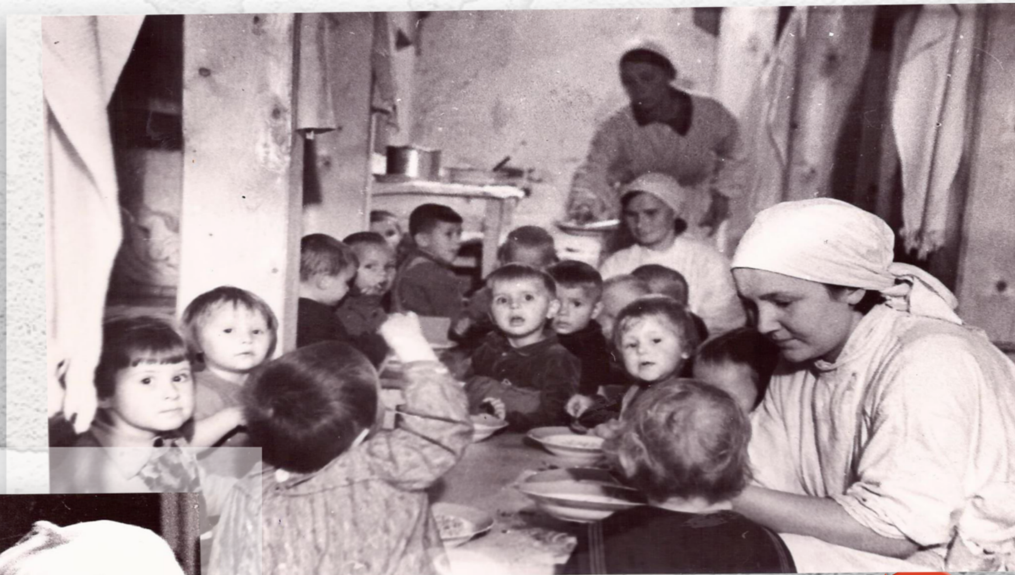
В бомбоубежище детских яслей No 8 (1942 г.)