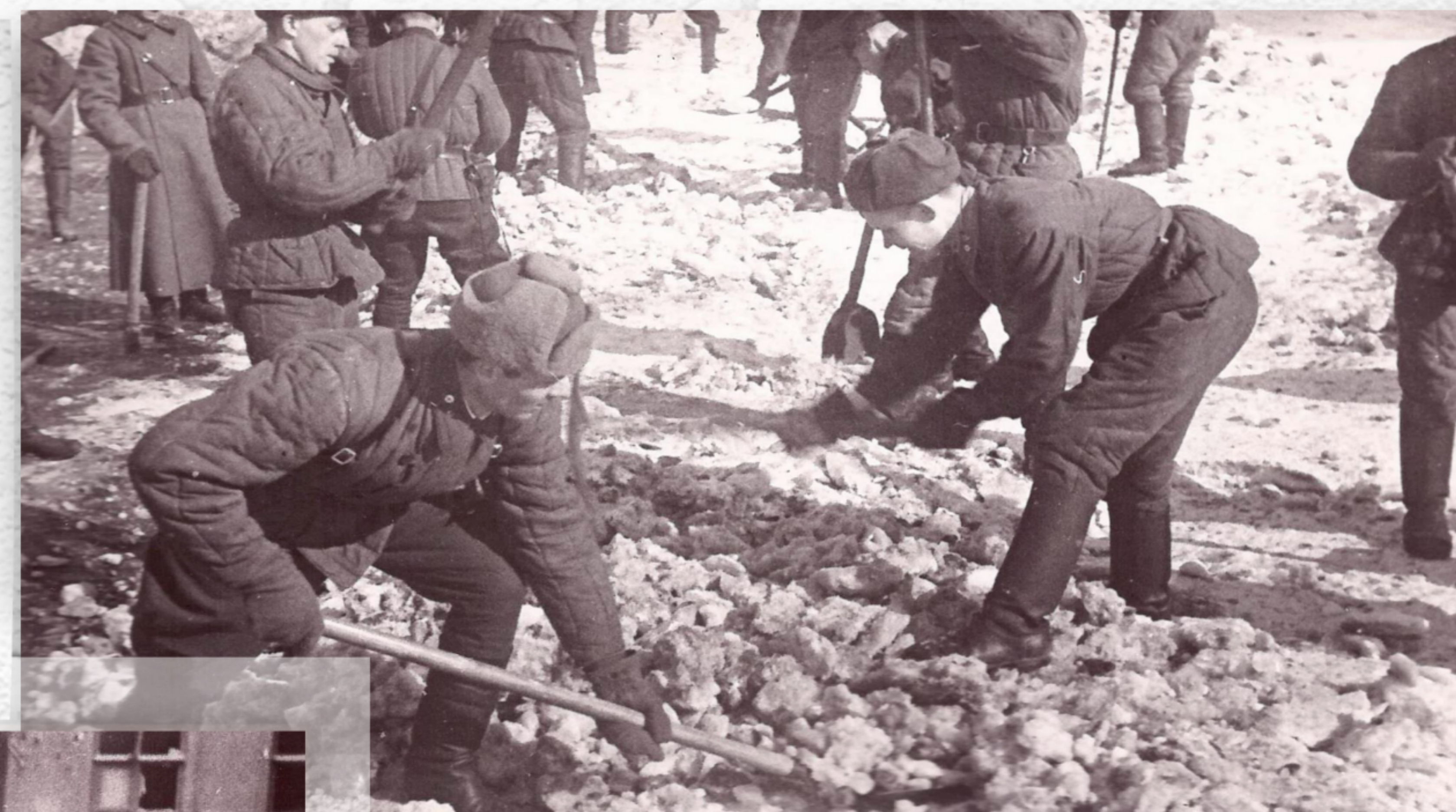
Воины Ленинградского гарнизона на работах по очистке города от снега и льда (весна 1942 г.)