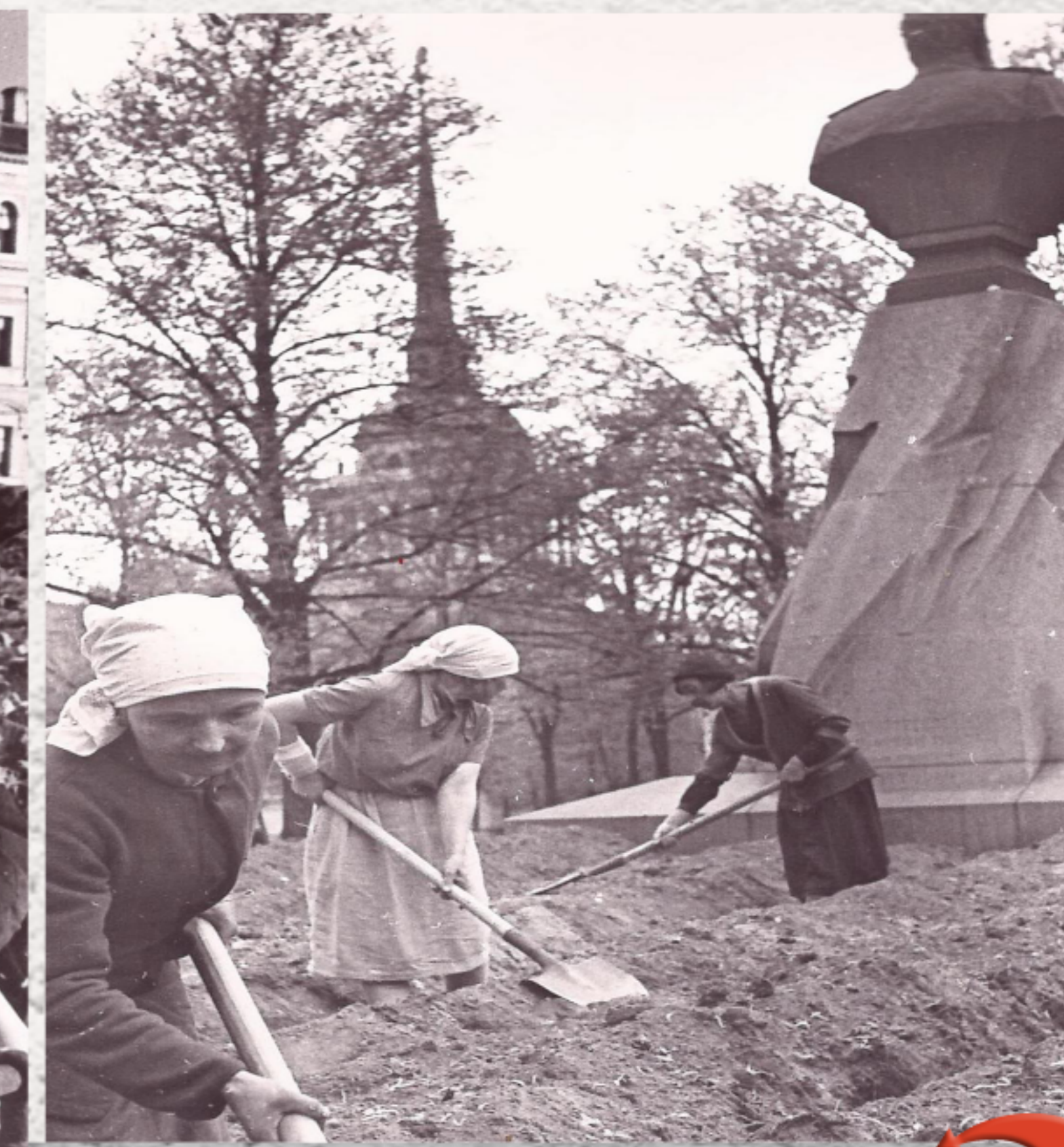
Каждый клочок земли был использован под огороды (июнь 1942 г.)