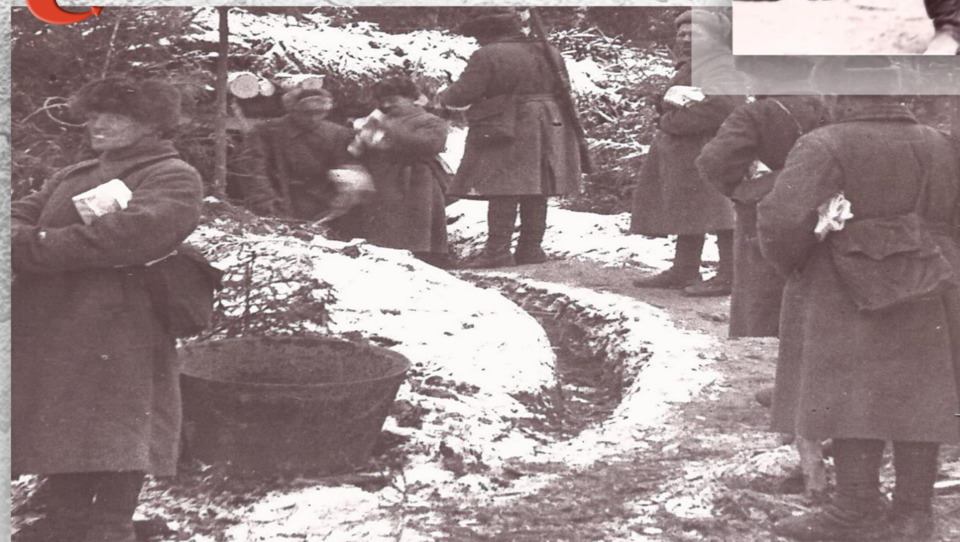
Помывка личного состава войск в бане-землянке на передовой (1942 г.)