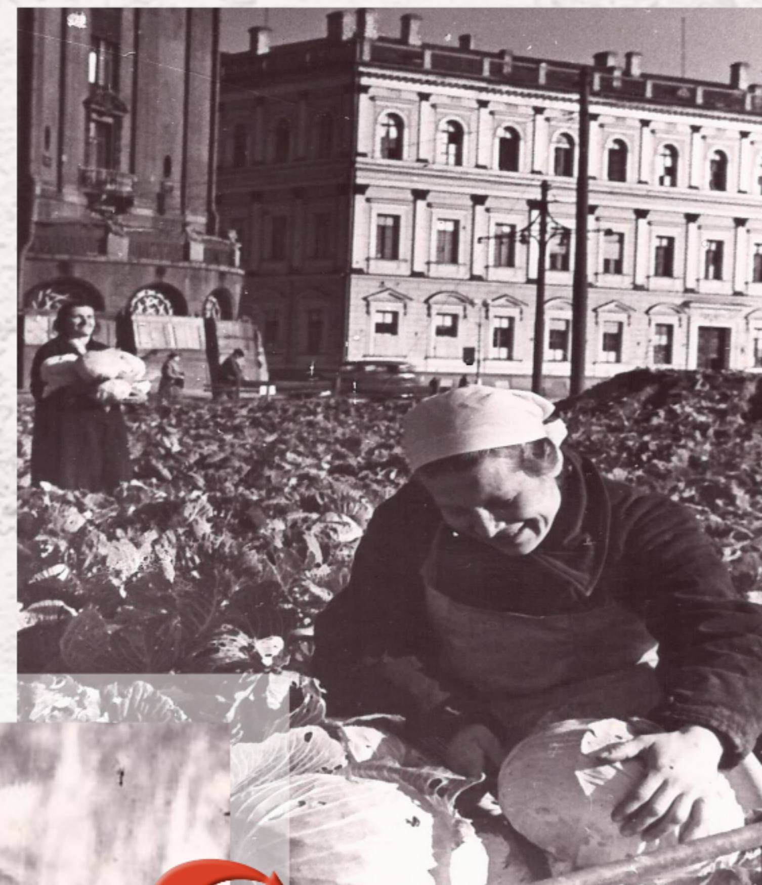
Блокадный урожай капусты, выращенной в сквере на Исаакиевской площади (1942 г.)