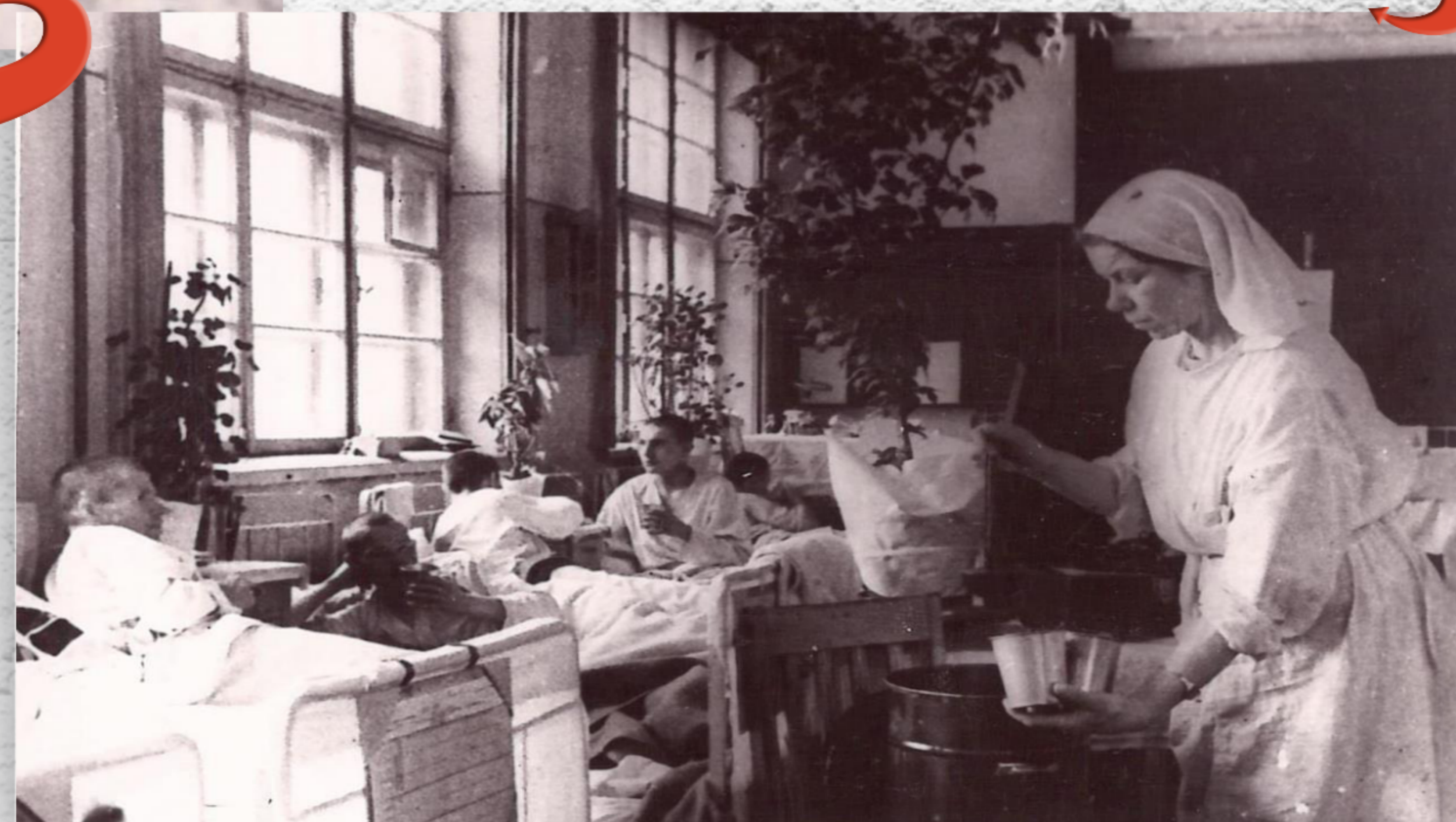
Выдача больным чая (1943 г.)