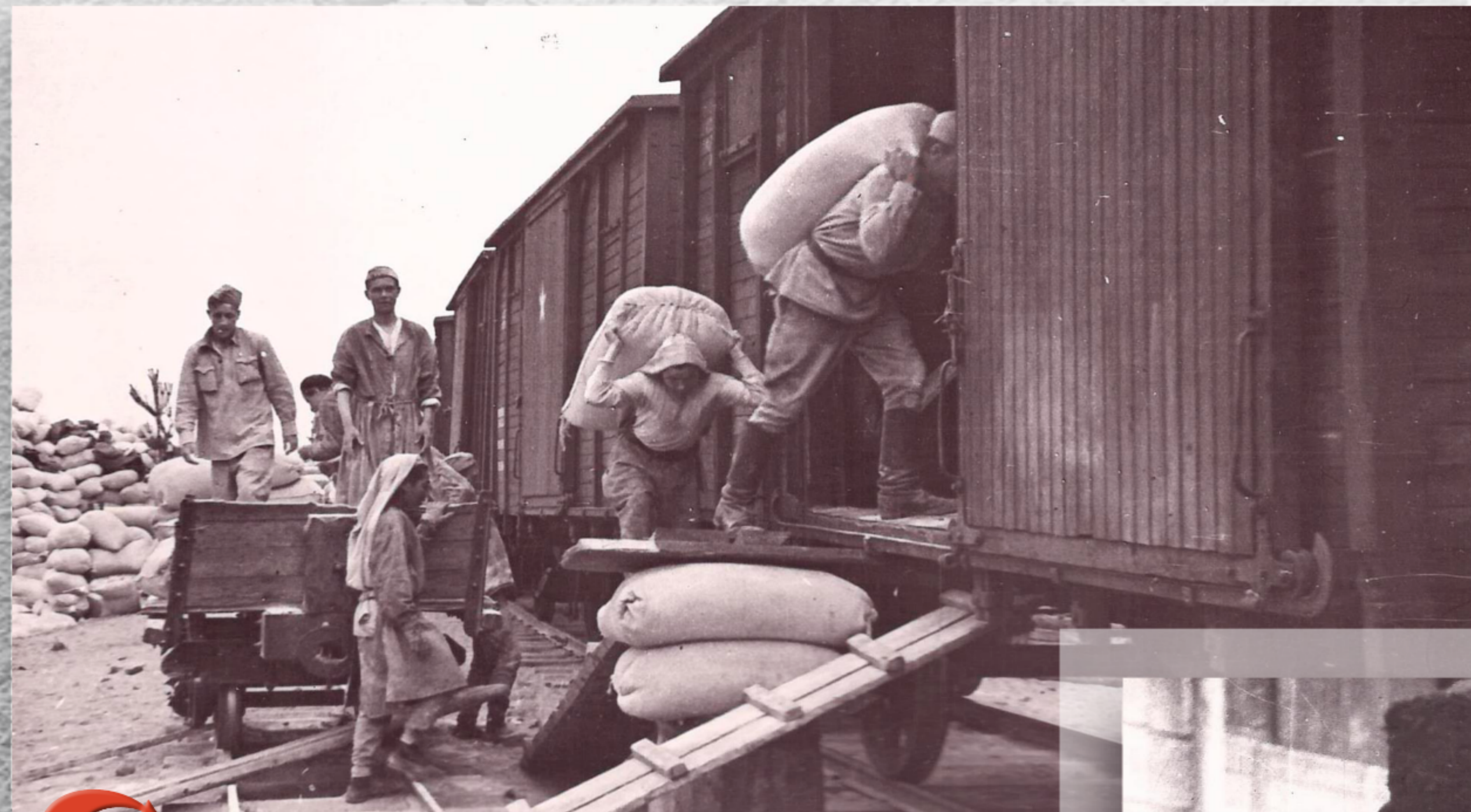
Погрузка муки для Ленинграда (июль 1942 г.)